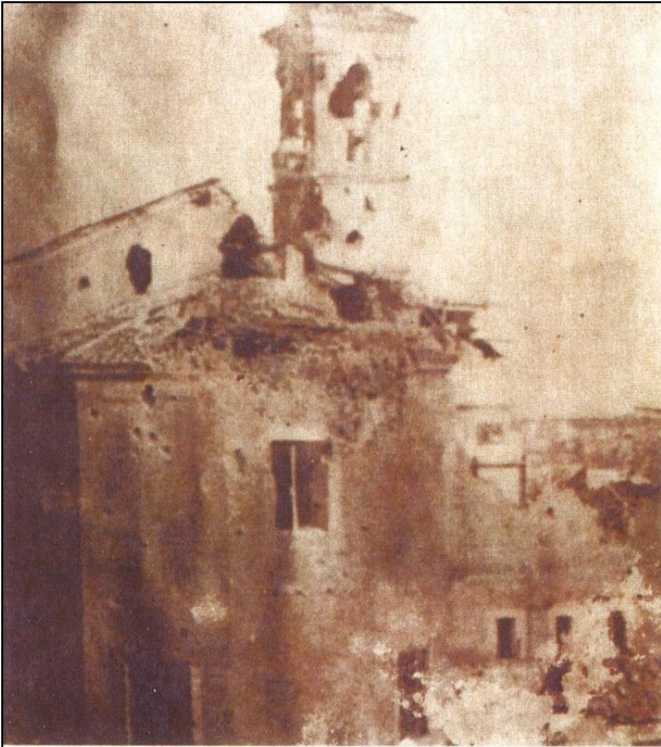
Così era ridotto S. Pietro in Montorio dopo i cannoneggiamenti dei francesi